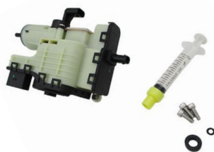
Meat&Doria 73000 Hoffer Products 7503000