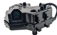
Meat&Doria 73522 Hoffer Products H73522