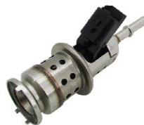
Meat&Doria 73012 Hoffer Products 7503012