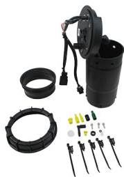
Meat&Doria 73019 Hoffer Products 7503019