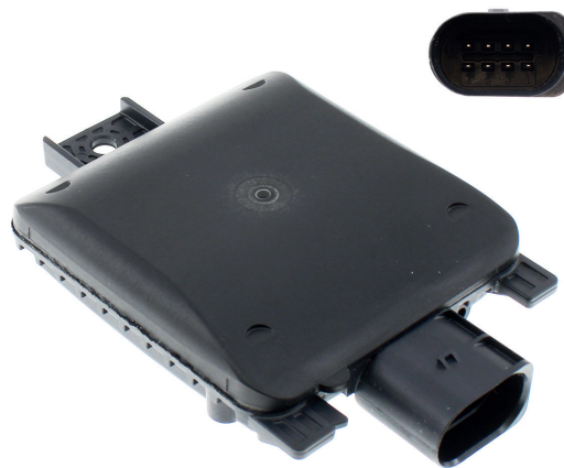
Meat&Doria 710001 Hoffer Products H710001

Ils fournissent au conducteur des informations claires sur la distance des obstacles détectés.